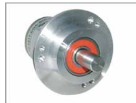
Absoluter Drehgeber WDGA58B