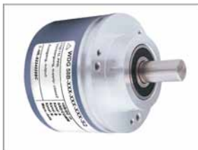
Inkrementaler Drehgeber WDG58B

Stellen Sie sich Ihr System passend für Ihre Schachtkopierung zusammen, indem Sie sich Ihren Drehgeber auswählen und die Länge des Spezialriemens bestimmen.