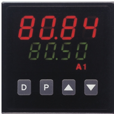
T48 in Originalgröße

Dieser kleine Temperaturregler ist ein Alleskönner. Mit einem neu entwickelten Thermo-ASIC ausgerüstet, werden moderne Programmier-, Bedien- und Kontrolltechnologien in einem für den rauen industriellen Einsatz konzipierten Gehäuse realisiert. Alles wurde dafür getan, damit der T48 schnell in Betrieb genommen, einfach und sicher bedient werden kann und seine Aufgabe jahrelang effizient ausführt. Schließlich sorgt eine überlegene Funktionalität für die einfache Anpassung an alle erdenklichen Regelaufgaben.