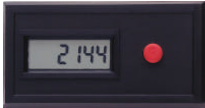
CUB 3 in Originalgröße

Der CUB 3 ist ein preiswerter, 6-stelliger Summenzähler für Stückzahlen, Hübe, Takte usw. Er kann Eingangsimpulse bis zu einer Frequenz von max. 100 Hz verarbeiten. Eine Zählerrückstellung ist über die Fronttaste oder einen Reseteingang möglich. Die Installation erfolgt durch einfache Schnappmontage.