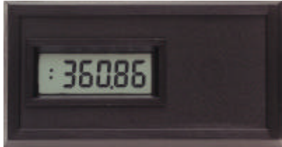
CUB 3T in Originalgröße

Der CUB 3T erfaßt die Betriebszeit von Maschinen und Anlagen. Die Ansteuerung kann über einen Schaltkontakt oder eine angelegte Spannung erfolgen. Ist der Zähler aktiv, so erscheint ein blinkender Doppelpunkt am linken Rand der Anzeige. Die Geräte sind in verschiedenen Anzeigeformaten erhältlich (Auflösung von 0,1 min bis 1 h). Zusätzlich zur externen Rückstellung kann die Anzeige optional über die Fronttaste zurückgestellt werden.