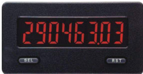
CUB 5 in Originalgröße

Der CUB5 ist eine preiswerte Anzeige für 2 Zählwerte und eine Geschwindigkeit. Er kann z.B. als Positions-, Drehzahl-, Stückzahl-, Geschwindigkeits- oder Durchfluß-Anzeige verwendet werden und läßt sich durch seine einfache Programmierung sofort in Betrieb nehmen.