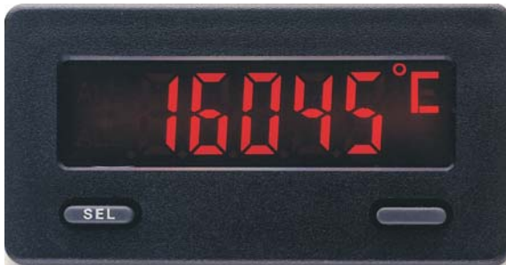
CUB5TC in Originalgröße

Der CUB5TC ist eine preiswerte Temperaturanzeige für Thermoelemente. Er wird über die beiden Fronttasten einfach programmiert und wurde für den rauen Industriebetrieb entwickelt. Typischen Einsatz findet er dort, wo vor Ort Temperaturen angezeigt werden z. B. Industriespülmaschinen, Heizungsbau, Nahrungsmittel- und Folienverpackungsmaschinen und in der chemischen Industrie.