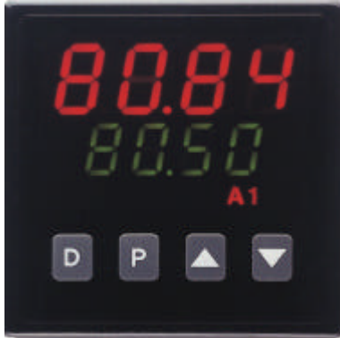
P 48 in Originalgröße

Dieser kleine Prozeß-Regler ist ein Alleskönner. Mit einem neu entwickelten ASIC ausgerüstet, werden moderne Programmier- und Kontrolltechnologie, in einem für den rauen industriellen Einsatz konzipierten Gehäuse realisiert. Alles wurde dafür getan, damit der P48 schnell in Betrieb genommen werden kann, einfach und sicher bedient werden kann und seine Aufgabe jahrelang effizient ausführt. Schließlich sorgt eine überlegene Funktionalität für die einfache Anpassung an alle erdenklichen Regelaufgaben.